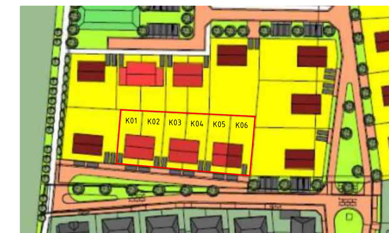
Situatie Gemeente Cuijk Plan Achter de Molen RIJKEVOORT niet op schaal